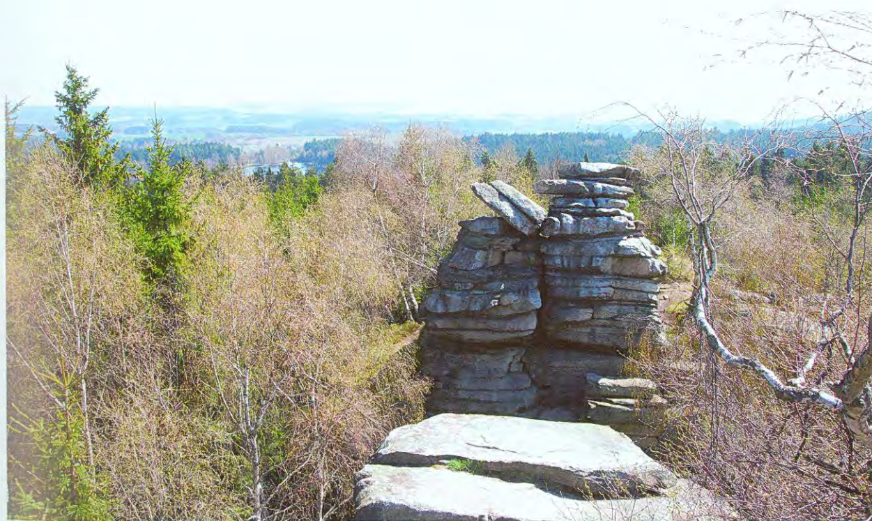
Míchova skála u Řásné (2018).

Ubíhala léta a staletí a postupně v kraji vznikla menší i větší sídla v čele s Jihlavou, nedlouho po založení proslulou svými stříbrnými doly a vzápětí i písemnou formulací horního práva, ležící přesně ve středu Českomoravské vrchoviny. A tehdy, přibližně v první třetině 13. století, také začíná vlastní příběh zdejšího vyhledávání a dolování drahých kovů, který trval přes 700 let. Nahlédnout do historie a různých peripetií tohoto příběhu si dali za úkol tvůrci této publikace. Rozhodli se vyjít z geologických a mineralogických poznatků o zdejších ložiscích zlata a stříbra, zrevidovat takřka všechny postupně mizející pozůstatky po dolování a to vše konfrontovat nejen s výstupy nejnovějších archeologických a historických prací, ale i s lidovou hornickou tradicí, přežívající v některých místních pověstech. Výsledek této snahy předkládáme k laskavému posouzení čtenáři v této knize.