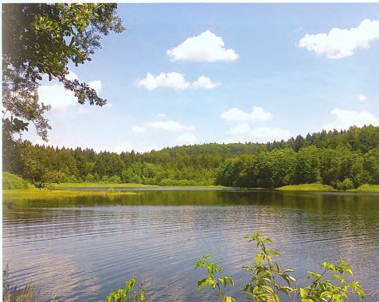
Pohled na rybník Horní Mrzatec u Mrákotína (2018,).